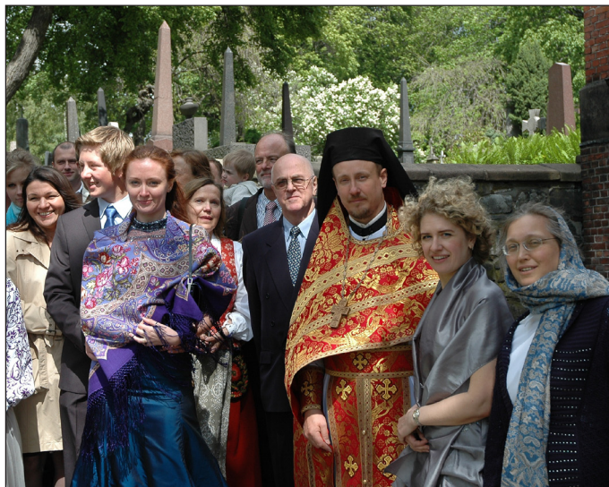
В день поздравления православных детей в возрасте «конфиркации». Осло, 2011 г.