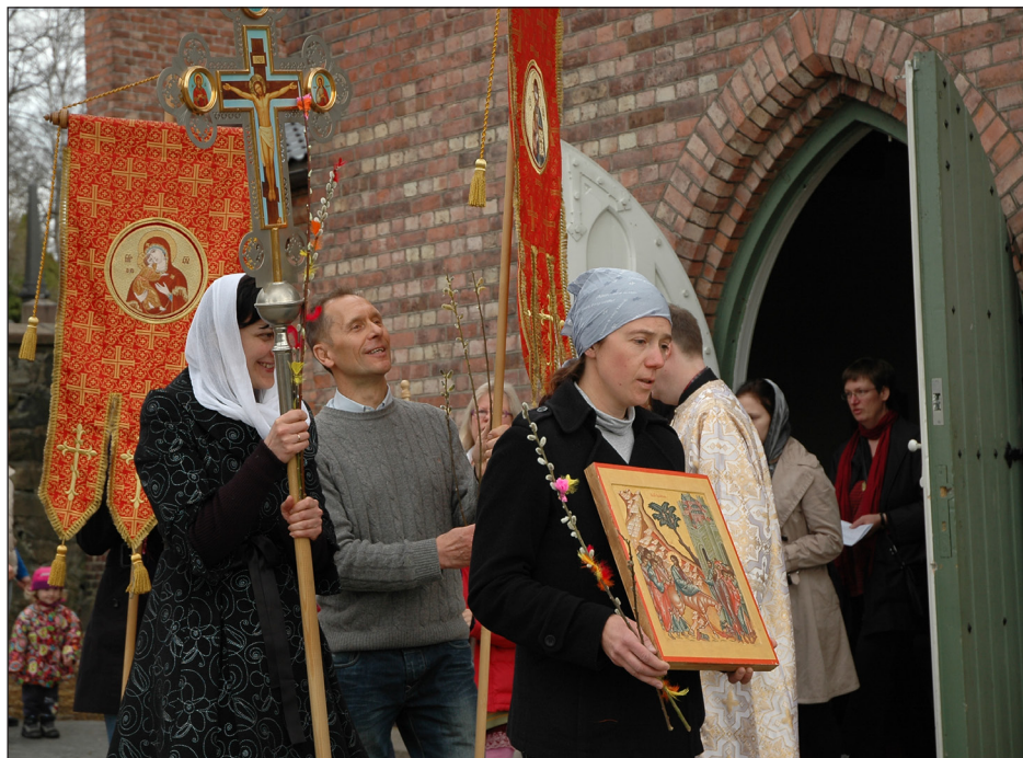
Крестный ход в Вербное Воскресенье. Осло, 2011 г.