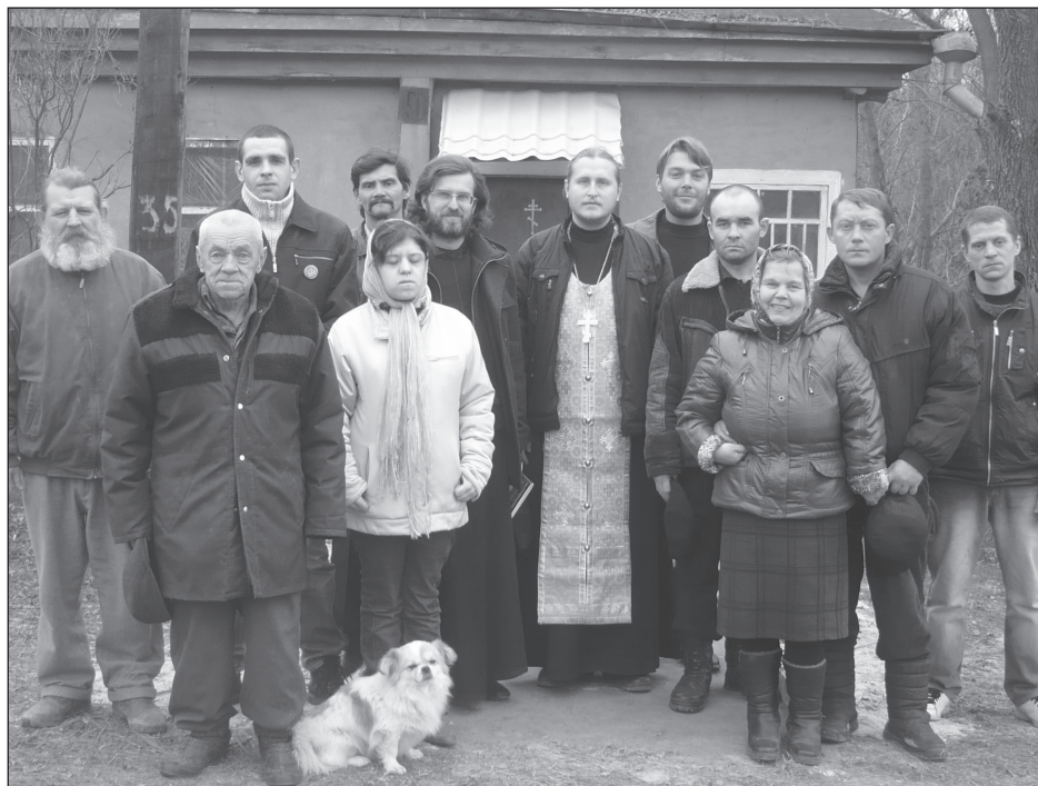
Жители общины «Троицкий посад» с. Борщёво