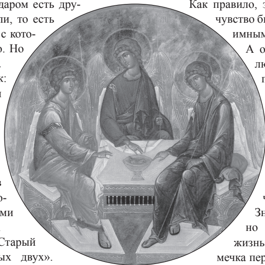
Икона Святой Троицы – символ божественной любви и единства

Один мой друг общался с девушкой. Но их общение происходило как-то вяло и на первый взгляд не обещало закончиться ничем серьезным. Я видел, что они очень хорошо подходят друг другу; девица из благочестивой семьи и имеет массу достоинств. Но на все мои уговоры обратить на нее внимание как на будущую супругу мой знакомый говорил примерно следующее: «Ну, не могу я ничего поделать, ведь здесь же нет ничего!» – и показывал на то место, где у человека находится сердце. Мол, сердцу не прикажешь. Слава Богу,