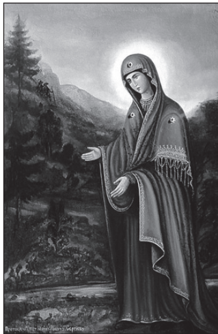
Образ Божией Матери «У источника»