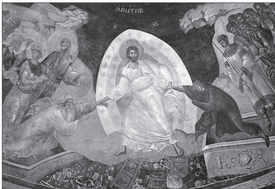
Древнее изображение Воскресения Христова из константинопольской церкви Хора. Спаситель воскрешает первых людей – Адама и Еву.

Что такое этот огонь неугасимый, Слово Божие не определяет, но дает образы неизъяснимых адских мучений.