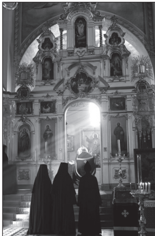
Божественная Литургия в Успенском соборе

вам придётся потрудиться. Никого, конечно, не принуждают, но уверяю, что внутренних голосов вам не позволит поступить по-другому. Получив благословение от помощницы игуменьи, мы отправились в указанный домик-гостиницу, находящуюся сразу за оградой монастыря. Матушка Татьяна поселила нас с сестрой в комнату с 2-мя девочками-подростками (которых родители отправили, похоже, на месяц) и ещё одной паломницей. Про отдельные кельи нужно забыть. Прибывшие группы часто селят по 8-10 человек. Это немного усложняет подготовку, например, к причастию. Двери закрываются в обители в 10 вечера. После этого времени никуда выходить не разрешается, а на улицу выпускают сторожевых собак. Это меры безопасности, а также своеобразная дисциплина.