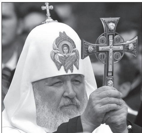
РУССКАЯ ЛЕПТА • №4/2009

благополучная жизнь несет в себе некие драмы и, даже может, быть катастрофы. Но для того, чтобы жизнь была благополучной даже при сложных внешних обстоятельствах, для того, чтобы человек был счастливым, для того, чтобы он имел возможность пройти жизнь, полную смысла, необходимо что-то очень важное иметь внутри себя. Я называю это внутренним человеком. Внутренний человек – это наше самосознание. Это мы, это наша душа. От состояния внутреннего человека, в конце концов, и зависит то, что мы называем человеческим счастьем. При определенных условиях, если этот внутренний человек правильным образом сформирован, даже внешне катастрофические условия жизни неспособны разрушить того, что человек называет счастьем...»