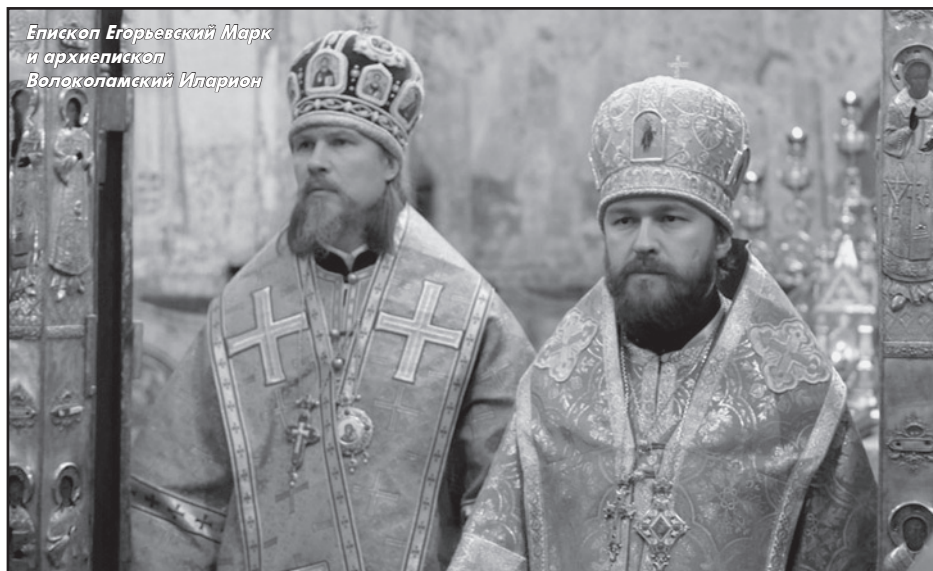
Епископ Егорьевский Марк и архиепископ Волоколамский Иларион

Председателем Отдела внешних церковных связей Московского Патриархата назначен епископ Волоколамский Иларион, который тоже неоднократно посетил Норвегию.