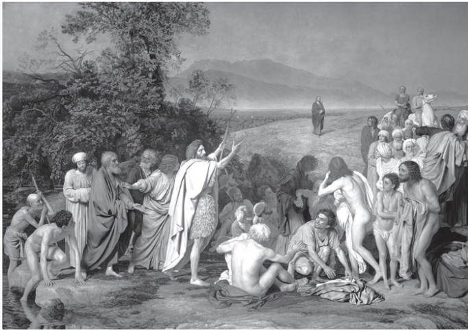
Гоголь изображен в известной картине Иванова «Явление Христа народу»